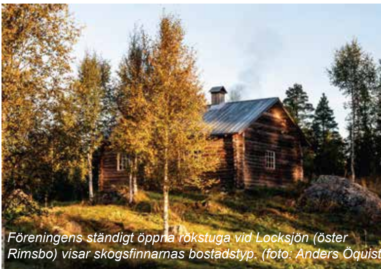
Föreningens ständigt öppna rökstuga vid Locksjön (öster Rimsbo) visar skogsfinnarnas bostadstyp.